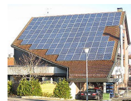
Bürgerhaus Lindorf (2008) 22 kW Module Suntech Power, WR Kaco