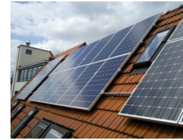
Fahrradgeschäft in Nürtingen (2010) 5,06 kW Module IBC Monosol, WR SMA

Vertrieb von Ökostrom und günstigem Gas bei gleichzeitiger Förderung lokaler Photovoltaikanlagen.