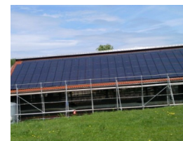
Sonnendach Hof Ziegelhütte GbR in Bissingen (2010) 37 kW Module Aleo S77, WR SMA