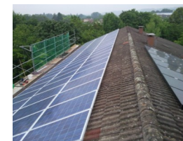
Mietshaus Gräfenbergstrasse Kirchheim (2010) 38 kW Testanlage (Süd: Kristalline Suntech Module, Nord: Dünnschicht Kaneka Module) Planung, Lieferung, Bau, Simulation, Betriebsführung