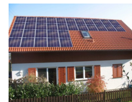
Fotomontage für eine Anlage in Kirchheim Ötlingen (2009) Auf Wunsch können wir auch für Ihr Gebäude eine Fotomontage erstellen