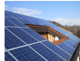
Familienhaus in Ebersbach (2009) 10,81 kW Module Aleo/Bosch, WR SMA